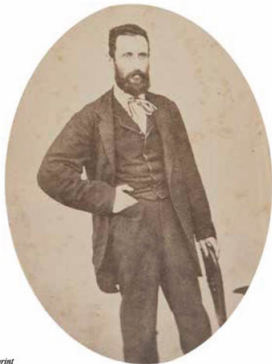
Alessandro Pavia (Milano, 1824 - Genova, 1889)