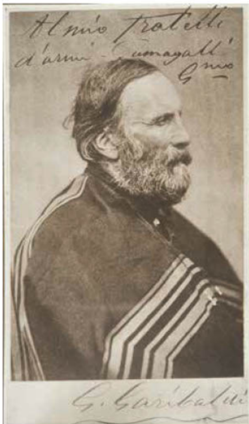
Anonimo Ritratto di Giuseppe Garibaldi Portrait of Giuseppe Garibaldi Seconda metà del XIX secolo / Second half of the 19 th century Albumina / Albumen print